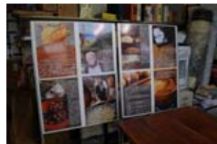
地域のお宝再発信(能登町)