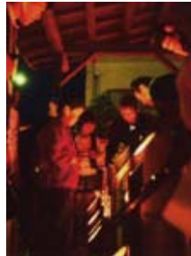
金沢ひがし竹灯り(金沢市)