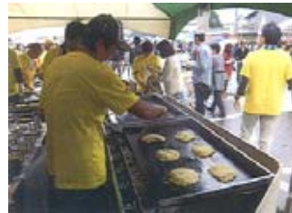
鶴来の新名物TKGY (白山市)