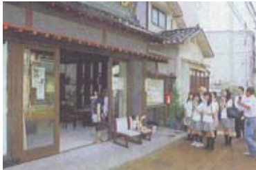
民家の甲子園(小松市)