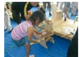
新キャラのいすづくり (かほく市)