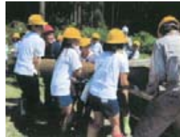
かわづくり・まちづくり (加賀市)